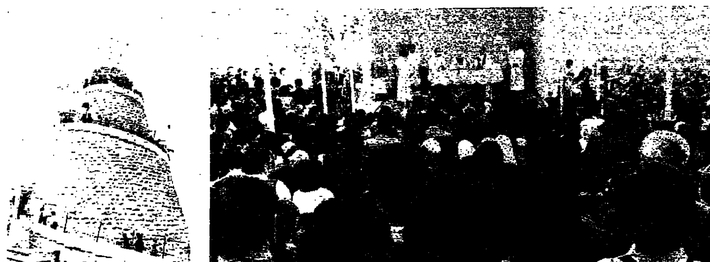
المطران صفيح يلقى كلمته استهلاكية حريصا في اول ايار